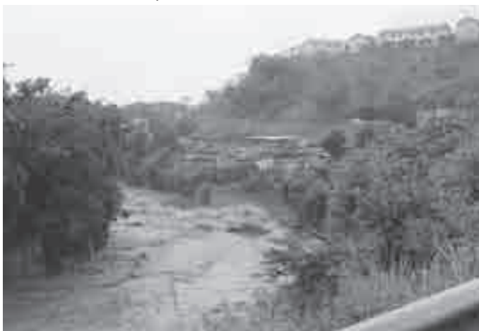
Ribeirão Arrudas na Região Metropolitana de Belo Horizonte