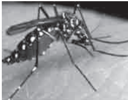
Aedes aegypti : calor, chuva e dengue

Com o aumento do calor e a chegada do período chuvoso há maior proliferação de insetos e com estes há possibilidades de maior circulação de vírus e por consequência de doenças tropicais. Nesta edição, o foco está centrado na dengue, doença que recebe muita atenção da mídia, mas que requer sempre um esforço de todos nós para sua superação.